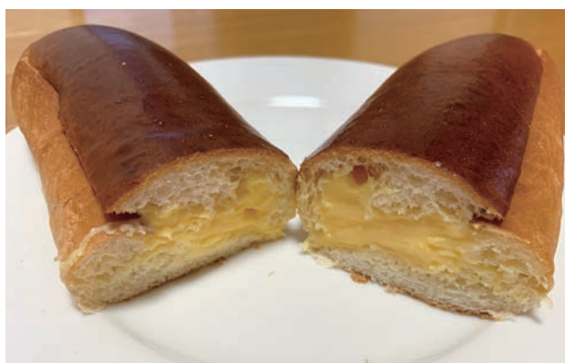
カスタードクリームコッペ

私が今のアパートに住むことにした決め手は、ピーターパンの近くだったからです。ハード系はなく、食事パンも少なく、昔ながらの総菜、菓子パンが多いお店です。カスタードクリームコッペは、鶴岡で売っているパンの中でも一番のお気に入り、他のお店には絶対ないパンです。以前は110円でしたが、今は130円。それでも大きくてコストパフォーマンスは高いし、何しろ美味しい。コッペパンもしっとりしていて、そこにラム酒が入ったカスタードクリームがたっぷり入っています。クリームの味も濃くて、ケーキ屋さんを含めこのカスタードクリームが一番おいしいと思います。よくあるグローブ型のクリームパンもありますが、こちらはラム酒なしの普通のカスタード。コッペの方は大人なクリームパンといった感じです。私はお酒が飲めませんがラムレーズンは好きなので、カス