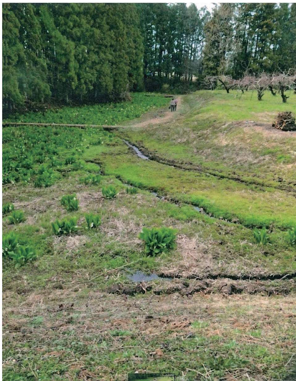
「水芭蕉の道を歩く人」