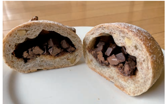
くるみとチョコのライ麦パン

のパンもトーストしなくてもカリカリでおいしいです。ここのチョココロネ（120円）はクリームがほかの所よりミルクチョコっぽく、先の方まで入っていてお勧め。くるみとチョコのライ麦パン（160円）はくるみが入ったライ麦の丸パンにキューブ状のミルクチョコがゴロゴロ入っていてこれもお気に入り。イチジクとクリームチーズのライ麦パン（180円）もくるみとチョコのライ麦パンと同じような感じでよく買っています。