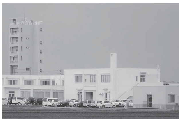
第 3 期