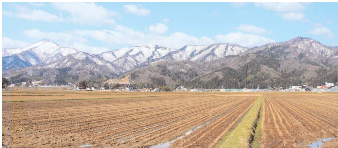
「 早春の金峰・母狩岳 」