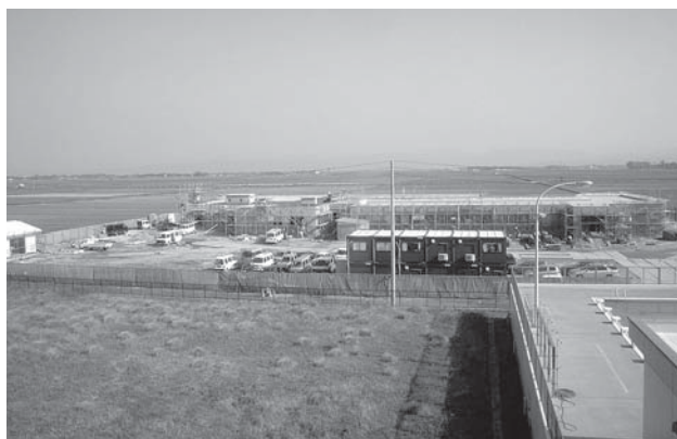
第 1 期工事中