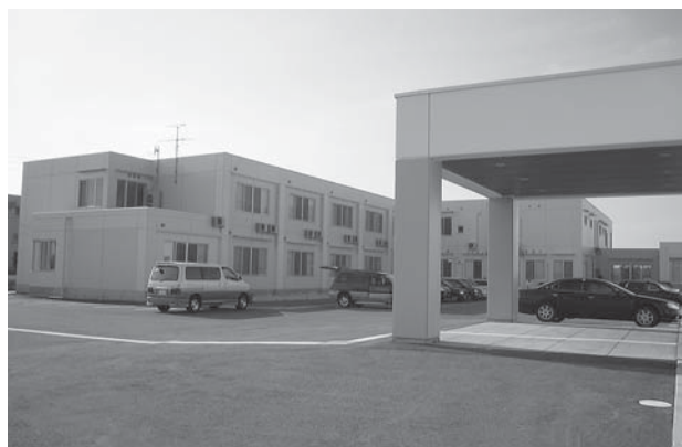
第 2 期病棟